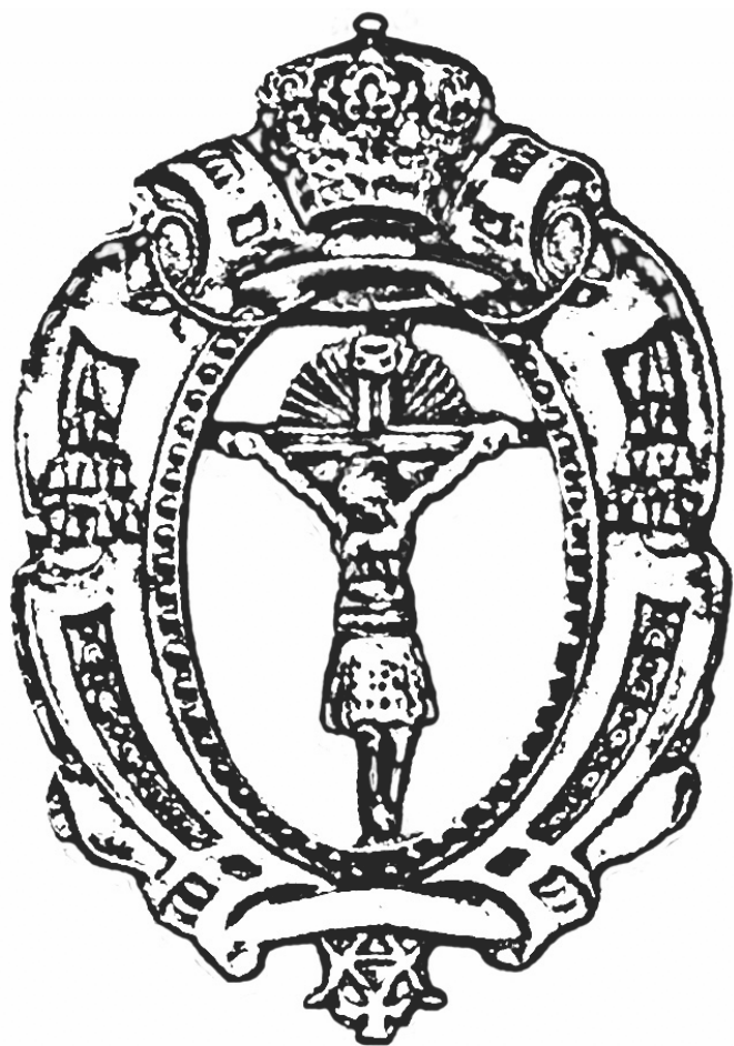
Medalla de la Hermandad del Santísimo Cristo de la Esperanza de Algete